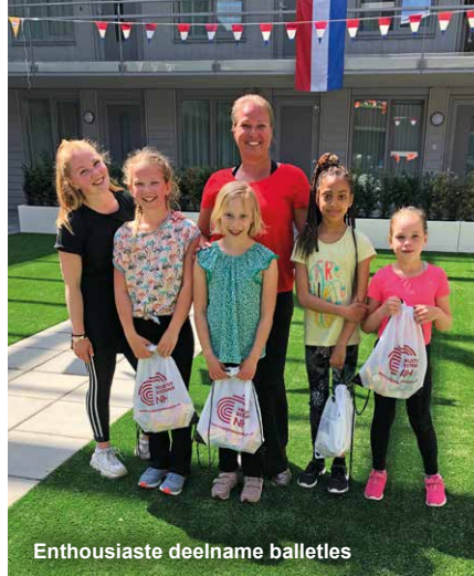
Enthousiaste deelname balletles

Bewoners van ons woongebouw aan de Hollandse Cirkel genoten dit voorjaar van een show van de Hoornse Balletschool. In de binnentuin showden jonge ballerina's hun keurig ingestudeerde danspassen. En dat onder- vond navolging!