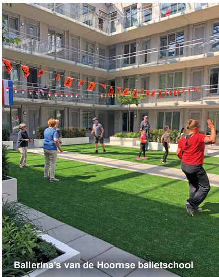
Ballerina's van de Hoornse balletschool

Na het optreden werd het publiek uitgenodigd voor een gezamenlijke dansles. Met in achtname van de 1,5 meter natuurlijk. De benen gingen van de grond en de armen de lucht in. Een aantal enthousiaste bewoners bleek over onvermoede danskwaliteiten te beschikken. Dat gold ook voor de dansende bewoners op de balustrades.