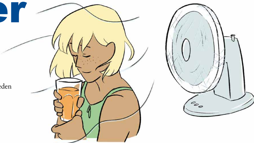
Een ventilator koelt niet, maar verlaagt de gevoels temperatuur met 2 á 3 graden.