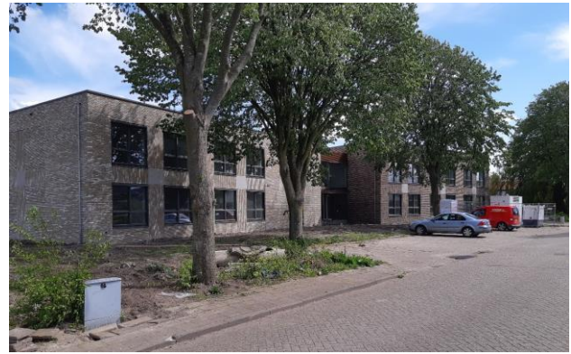
Voorzijde nieuwe Sorghvliet