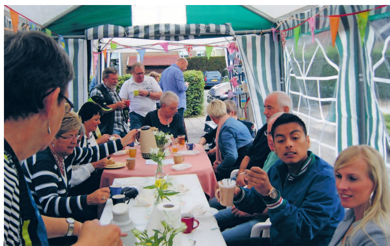
Een jaarlijkse buurtbarbecue zorgt voor verbinding

www.wst-betgrootslag.nl/huurzaken/problemen-met-de-buren/