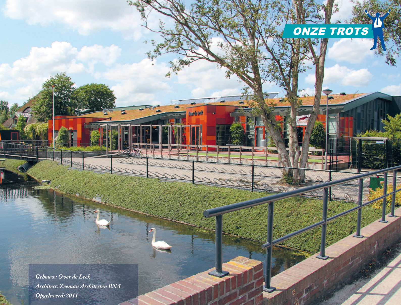
Gebouw: Over de Leek Architect: Zeeman Architecten BNA Opgeleverd: 2011