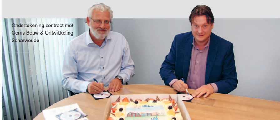
Ondertekening contract met Ooms Bouw & Ontwikkeling Scharwoude

De start van de bouw van de zorginstelling aan de Streekweg 298 is uitgesteld tot januari 2018. Dat heeft te maken met het uitlopen van de sloop- en aansluitend de vervolgwerkzaamheden. Na de aanbesteding in april volgde een bezuinigingsronde. Op 11 september is het aannemingscontract met Ooms Bouw ondertekend. De verwachte oplevering is eind 2018 / begin 2019.