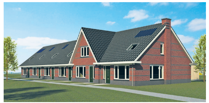
Nieuwe huurwoningen Graspieper opgeleverd

Nadat de Pimpelmezen en Braamsluiers alweer een tijdje wonen in hun huurwoning in plan Reigersborg-Noord III in Hoogkarspel, zijn nu de Graspiepers aan de beurt om zich te nestelen. Deze maand ontvangen de bewoners van de zes huurwoningen aan de Graspieper de sleutel. Het gaat om een-gezinshuizen met slaap- en badkamer op de begane grond.