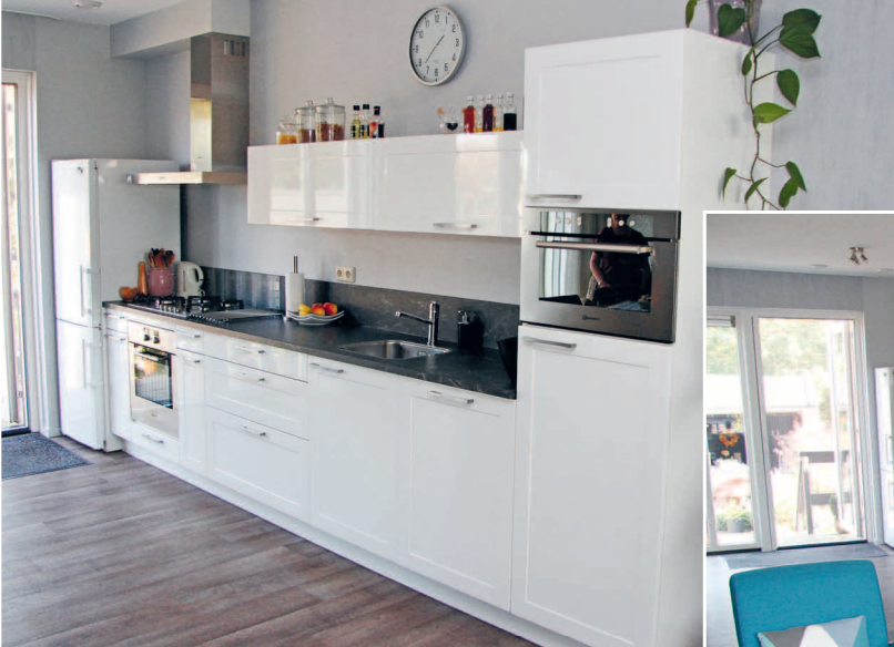
De royale open keuken

De lange wand wordt onderbroken door behang met motief